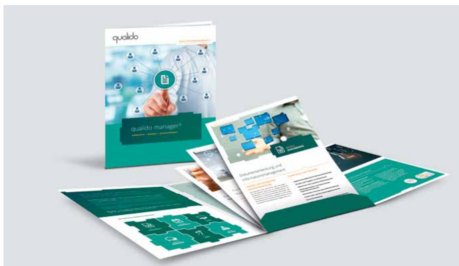
Die richtige Gestaltung einer Produktbroschüre macht komplexe Softwareprogramme leicht verständlich.