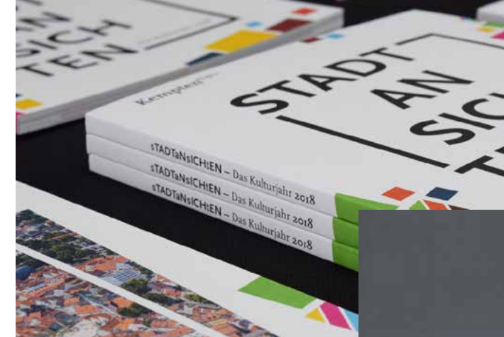
Ein Ausstellungskatalog nach White & friends: kreative Gestaltung, Spielerei mit der Sprache und angenehm wenig auf Weiß.